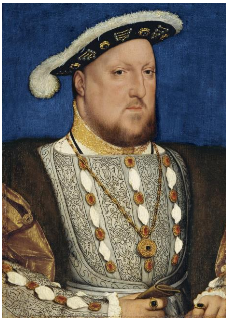
Hans Holbein el Joven Retrato de Enrique VIII de Inglaterra hacia 1537 Óleo sobre tabla. 28 x 20 cm Enlace a ficha de la obra (incluye versión en alta calidad)