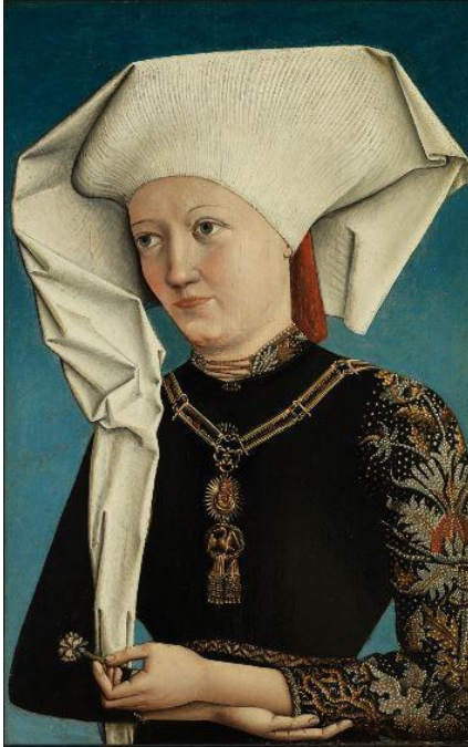
Anónimo alemán activo c. 1490. Retrato de una dama con la Orden del Cisne. hacia 1490 Óleo sobre tabla. 44,7 x 28,2 cm. Enlace a ficha de la obra (incluye versión en alta calidad)