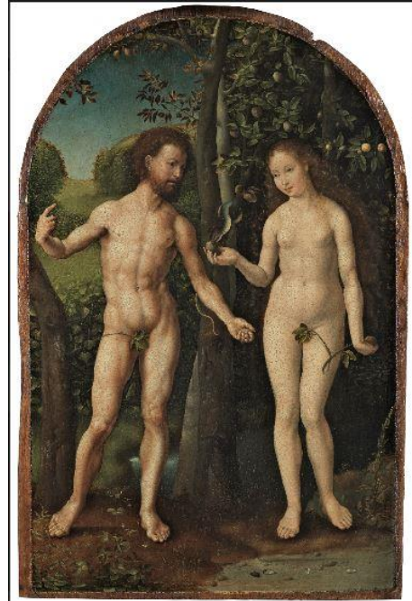
Jan Gossaert (llamado Mabuse) Adán y Eva hacia 1507 - 1508 Óleo sobre tabla. 56,5 x 37 cm Enlace a ficha de la obra (incluye versión en alta calidad)